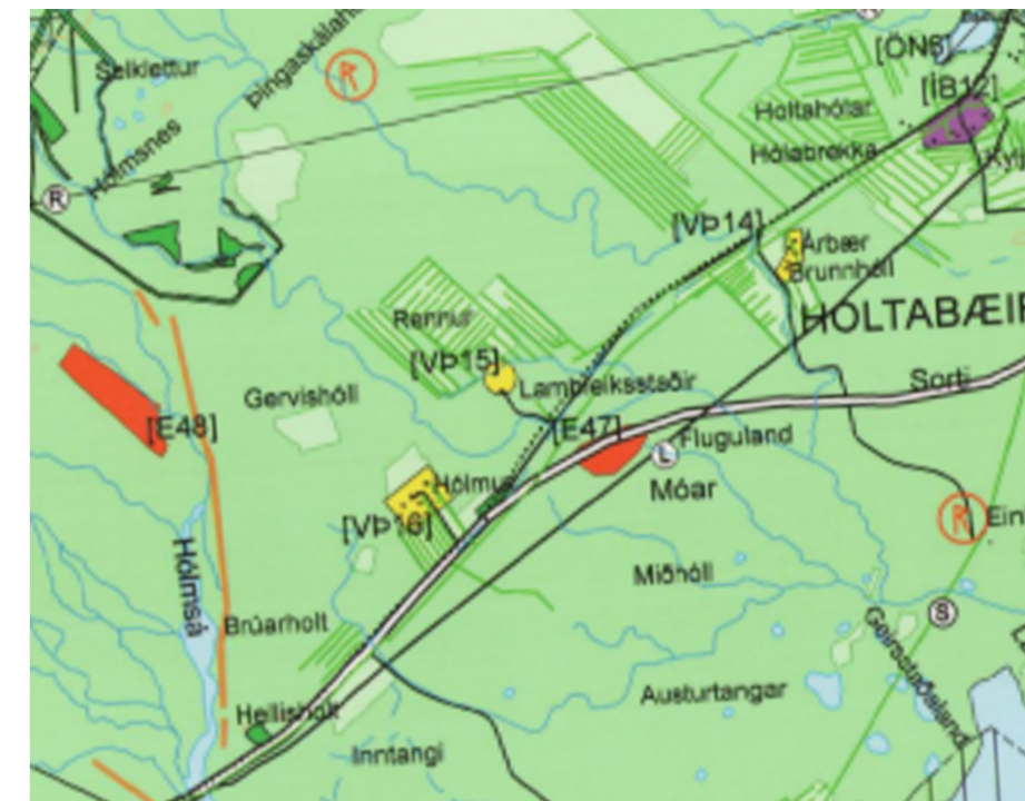
Aðalskipulag Hornarfjarðar 2012-2030

Breytt deiliskipulag er í samræmi við gildandi aðalskipulag og stefnu þess. Að ferðapjónusta verði aukin í sveitum Hornarfjarðar og eftir atvikum samþætt landbúnaði á lögbýlum, og stefnt verði að verulegri uppbyggingu gistirýma í sveitunum, á svæðum sem eru skilgreind sem verslunar- og þjónustusvæði samkvæmt Aðalskipulagi Hornarfjarðar (2012-2030, bls 28).